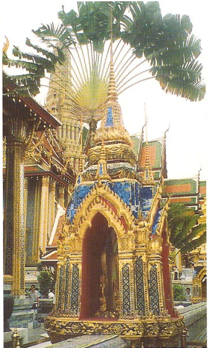
Fragment Wat Phra Kaew - Świątyni Szmaragdowego Buddy w Bangkoku.

Duży procent turystów odwiedzających Tajlandię przyjeżdża tam przede wszystkim aby odpocząć. Kraj ten ma przeszło trzy tysiące kilometrów wybrzeża, a najpiękniejsze jego fragmenty zostały przekształcone w doskonale wyposażone ośrodki wypoczynkowe o różnym standardzie i cenach. Turyści o grub-