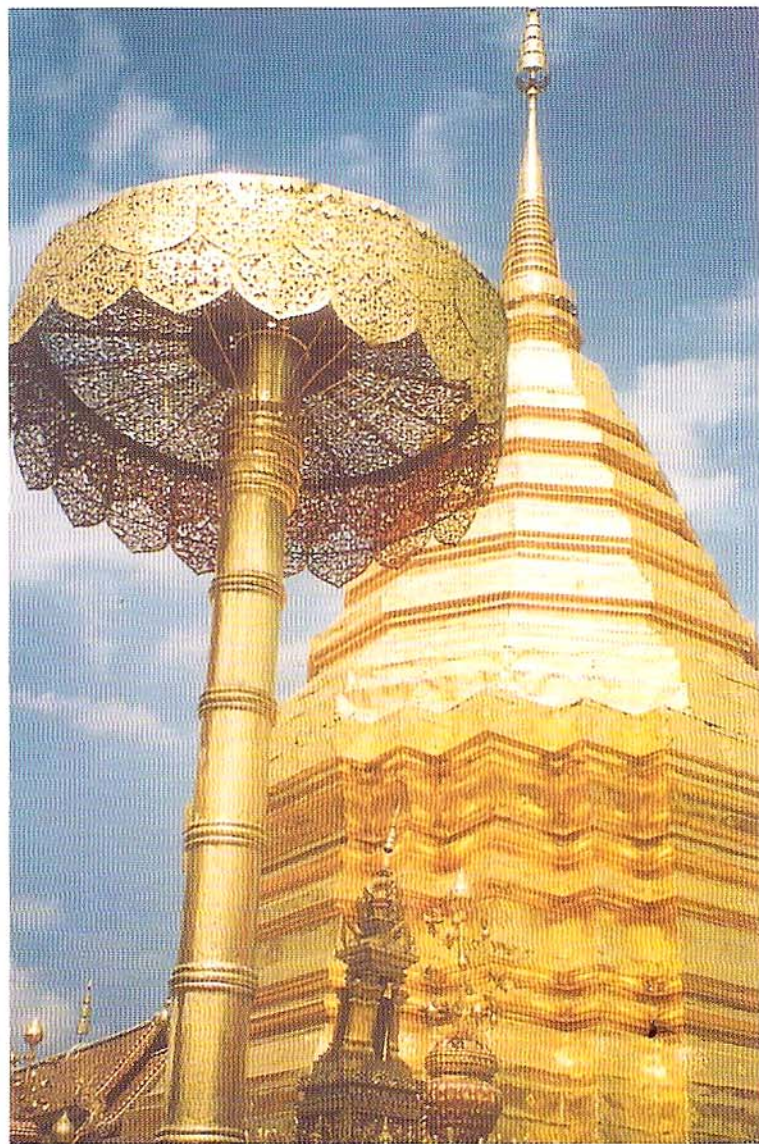
Świątynie w okolicach Chiang Mai olśniewają złotą ornamentyką.

budowle zdobione złotem, kamieniami szlachetnymi i porcelaną. Świątynia jest schronieniem dla najbardziej czczonego posągu Buddy w królestwie, 75-centymetrowej statuetki z czarnego nefrytu, której należy szacunek oddaje nawet król Tajlandii. Inne słynne miejsca, których nie może zabraknąć w programie każdej wycieczki do Bangkoku to Wat Po, w którym znajduje się 46-metrowy posąg leżącego Buddy oraz Wat Triamitr z 5,5-tonowym Buddą ze szczerego złota! Wszystkich świątyń w Bangkoku jest ponad 400, ale na szczególne wyróżnienie zasługuje także Wat Arun, czyli Świątynia Brzasku z wieżą wysokości 104m, nazywaną prangiem. Interesującym uzupełnieniem może być także wizyta w Muzeum Narodowym, na farmie krokodyli