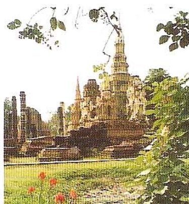
W Sukhotai uważanej za pierwszą stolicę Tajlandii przyroda znakomicie komponuje się z historią.

Wycieczka na słoniach to jedna z największych atrakcji północnej Tajlandii.