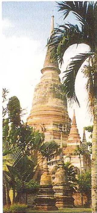
Wspaniała XIV-wieczna stupa (czedi) w Wat Yai Chai Mongkon w Ayuttahai.

łożone na dalekiej północy kraju miasto oferuje turystom łagodny klimat, kolorowe świątynie i niezapomnianą atmosferę, szczególnie w czasie licznych świąt, do których należy festiwal kwiatów obchodzony na początku lutego. Do najbardziej cenionych atrakcji okolic Chiang Mai należą odwiedziny w ośrodkach treningowych dla słoni, gdzie oglądać można słonie przy pracy, bez wysiłku przesuwające kilkutonowe drzewa, a także przejechać się na słoniu przez dżunglę lub spłynąć rzeką tropikalną na bambusowej tratwie. Miłośnicy pieszych wędrówek po górach mogą wybrać się na kilkudniowy trekking po okolicznych wzgórzach. Dla nich atrakcją będzie bujna przyroda oraz odwiedziny w wioskach miejscowej ludności – górskich mniejszości narodowych o bardzo interesujących zwyczajach i strojach.