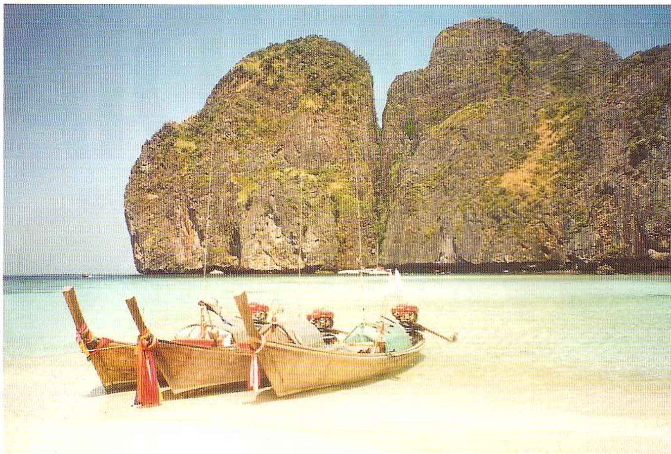
Cudowne tropikalne wody Morza Andamańskiego zapraszają do kąpiel. Na zdjęciu fragment wyspy Phi Phi.

rych rosną nie kończące się gaje palmowe, możliwość uprawiania sportów wodnych i doskonale jedzenie – prosto z morza. Można całymi dniami wylegiwać się na pięknej plaży, popijając zimne piwo i kąpiąc się w ciepłym morzu, uważając jedynie aby nie dostać porażenia słonecznego, o co przy tropikalnym słońcu nietrudno. Można nurkować na rafach koralowych otaczających wyspy, podglądając ży-